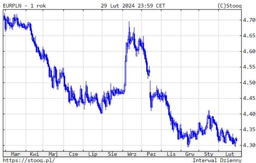
Wykres 5. EURPLN

Stopy zwrotu: 1 rok: -7.64% , YTD: -0.65%