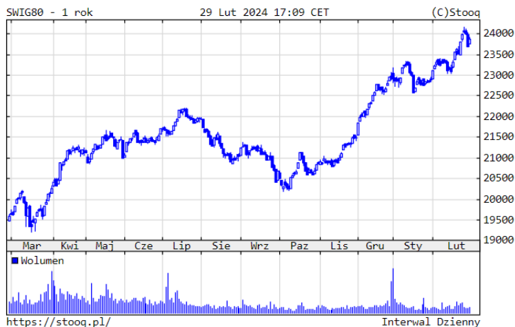
Wykres 3. sWIG80 – ostatni rok

Słopy zwrotu : 1 rok: +21.38% , YTD: +4.21%