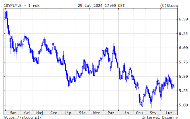
Wykres 4. Rentowność 10-letnich polskich obligacji skarbowych

Na rynkach obligacji skarbowych mieliśmy do czynienia z korektą notowań. Rentowność amerykańskich instrumentów 10-letnich wzrosła do 4,25%, niemieckich do 2,42%, a polskich nieznacznie do 5,31%. Sytuacja na naszym rynku papierów dłużnych korporacyjnych była bardzo dobra. Sprzyjał napływ środków do polskich funduszy dłużnych, które zanotowały znakomite wyniki inwestycyjne, najlepsze na poziomie +2% od początku roku.